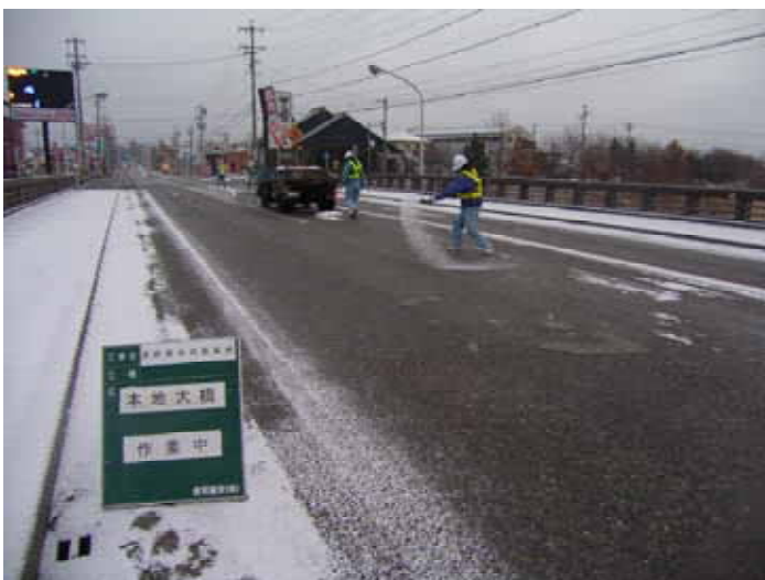
1月30日は未明からの雪が朝方の冷え込みにより凍結早朝からの塩カル散布を実施しました。