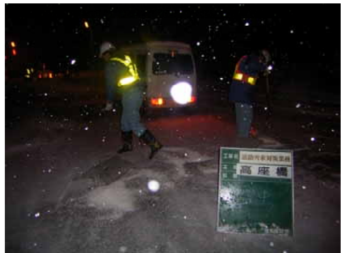
数年ぶりの大雪。1月17日は未明からの塩カル散布を実施しました。